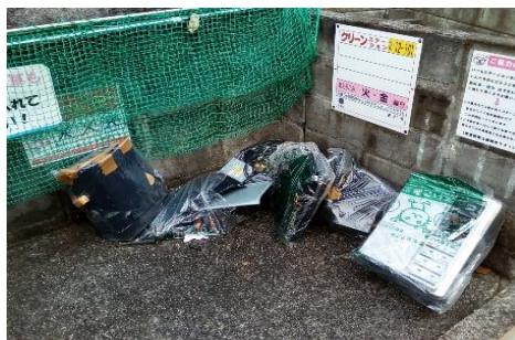
燃えるごみSTに燃えないごみ多量 （1丁目ST101）