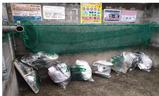
第二月曜に燃えないごみが多量に （2丁目ST260）