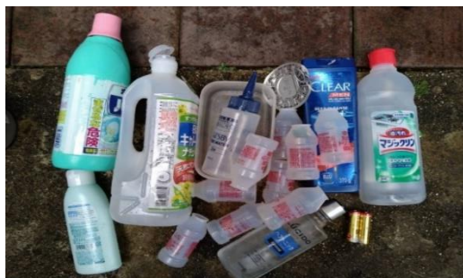
取り残しの缶ビンペットボトル袋の中にプラ容器等が多数（ST160）

コロナ禍のこの頃、取り残しごみの分別など掃除当番はじめ、みんなが不快な気持ちになります。自治会に苦情が来ています