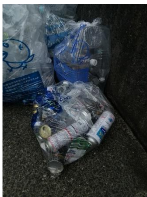
写真 1. スプレー缶混在

7月15日南公園（ST160）、7月29日南公園（ST160）、 北公園近く（ST360）、中公園（ST361）、8月5日南公園（ST160） 8月19日南公園（ST160）、8月26日南公園（ST160）