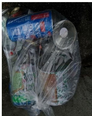
写真 2. オイル缶混在

ルール通り区分けをしてゴミ出しをし、取り残し0を目指しましょう！ 区分けで悩む時はワケトンブックを見てください。